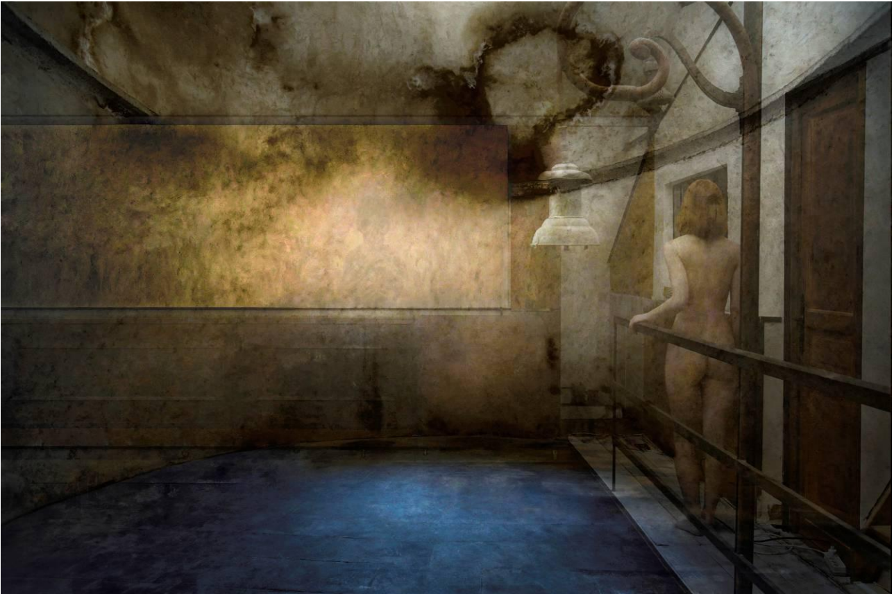
Gilles Desrozier-série-14 Etats de la passion amoureuse, Extase Ivresse 60X90cm 2015